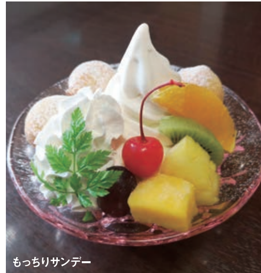
もっちりサンデー