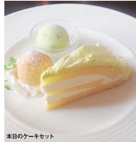
本日のケーキセット