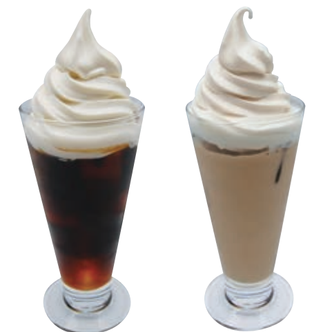
コーヒーフロート