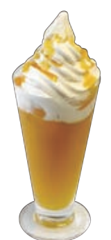
マンゴーフロート