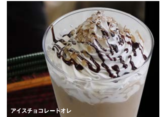
アイスチョコレートオレ