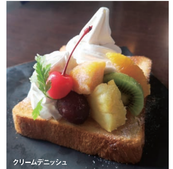
クリームデニッシュ