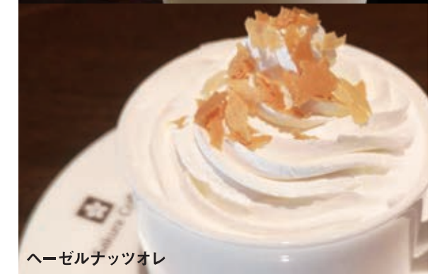
ヘーゼルナッツオレ