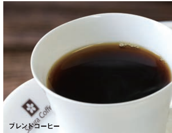
ブレンドコーヒー