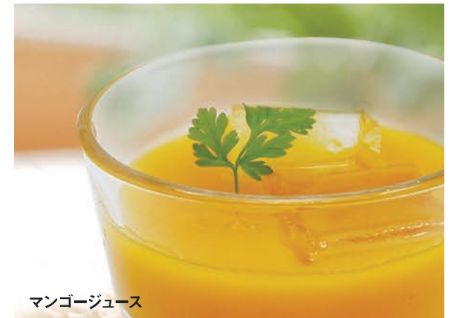
マンゴージュース