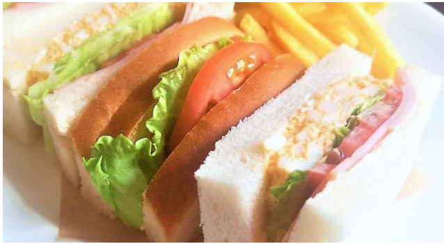
ミックスサンド ..... 700円 *パンをトースト(焼き)にもできます。 フライドポテト付