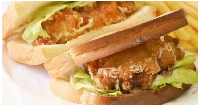
チキン竜田サンド ..... 880円 *パンをトースト(焼き)にもできます。 フライドポテト付