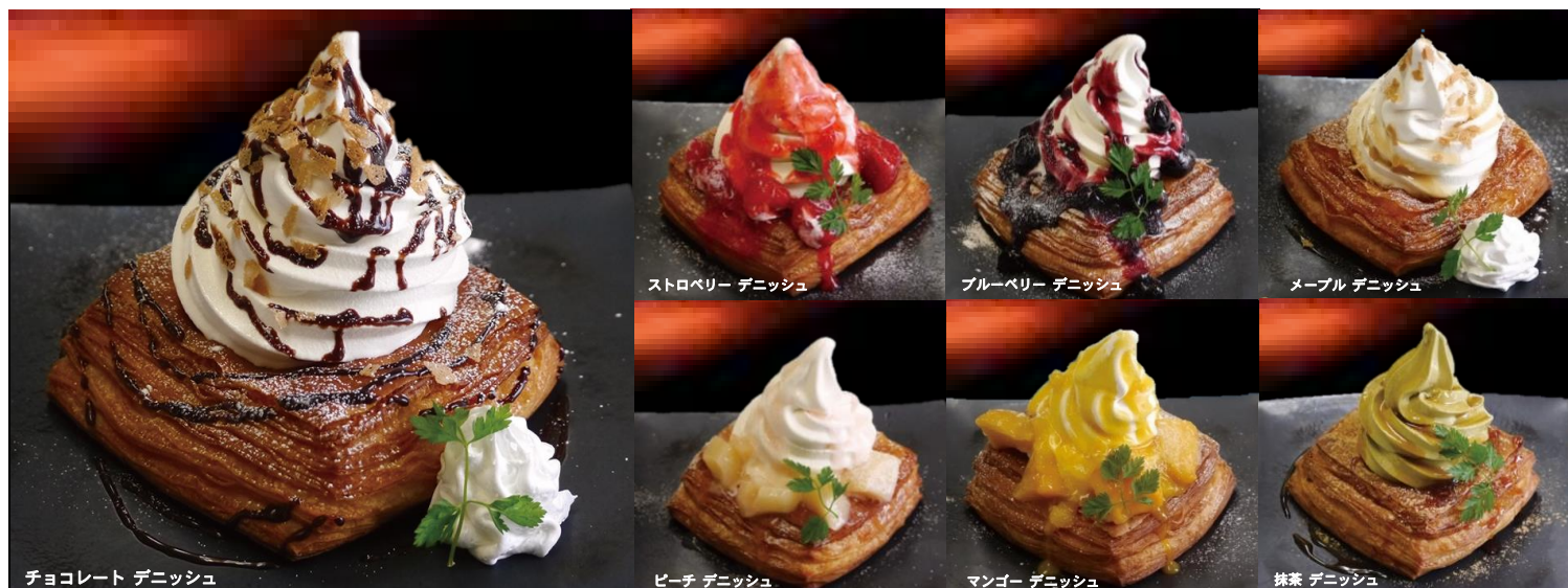
チョコレート デニッシュ 480円 +ドリンク代

*下記価格はセット価格となっております、単品でご注文の際は表示価格にプラス100円となります。*