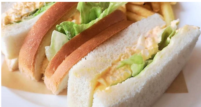
たまごサンド ..... 650円 *パンをトースト(焼き)にもできます。 フライドポテト付