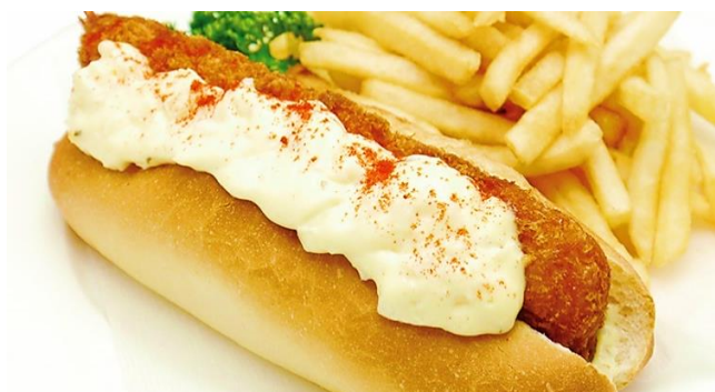
タルタル大海老サンド ..... 770円 フライドポテト付