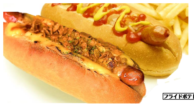
ホットドッグ ..... 520円 チーズドッグ ..... 570円 *チーズソースとワイド かわをトッピング フライドポテト付

*すべて税込み価格です* *お持ち帰りは商品代の2%を容器代としていただきます*