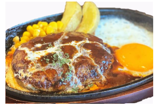
鉄板ハンバーグ 1,150円 デミグラスソース ライスorパン・サラダ・ドリンク付き