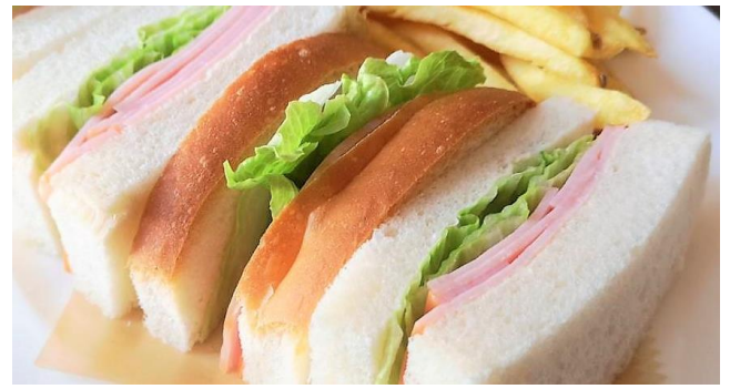
ハムサンド ..... 650円 *パンをトースト(焼き)にもできます。 フライドポテト付