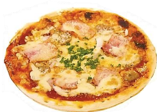
オリジナルピザ 750円