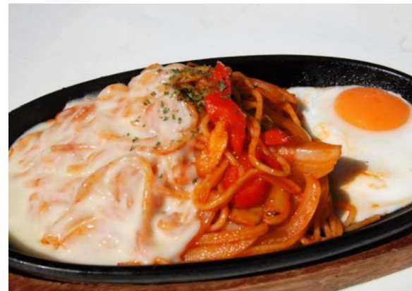
鉄板チーズナポリタン 1,050円 サラダ・ドリンク付き