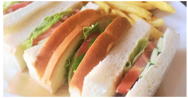
野菜サンド ..... 650円 *パンをトースト(焼き)にもできます。 フライドポテト付