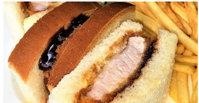
カツサンド ..... 900円 *パンをトースト(焼き)に変更もできます。 フライドポテト付