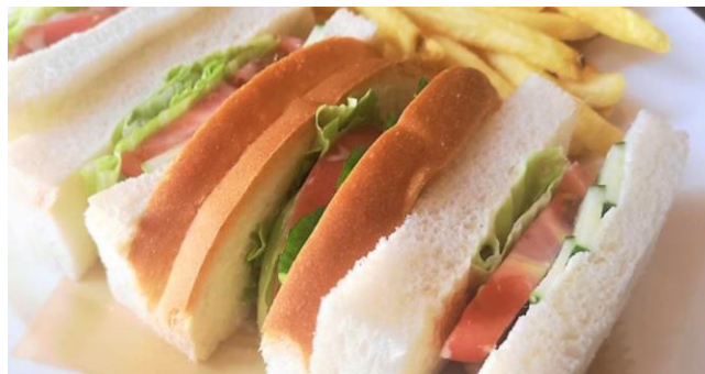
野菜サンド ..... 650円