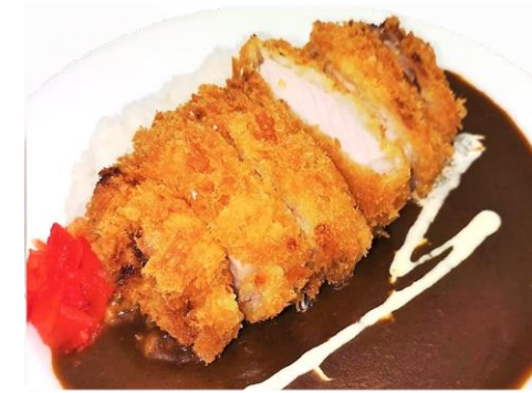
カツカレー 1,200円 サラダ・ドリンク付き