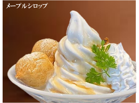
メープルシロップ