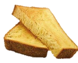
デニッシュトースト 400円 *小倉 or イチゴジャムからお選びください