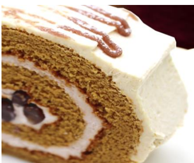
黒蜜きなこのロールケーキ 430円 +ドリンク代