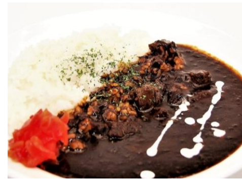
ビーフカレー 950円 サラダ・ドリンク付き