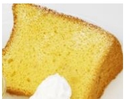
シフォンケーキ 270円