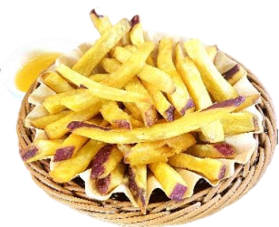
さつまいもスティック 480円 *特製ハニーソース or 大学いもソースからお選びください