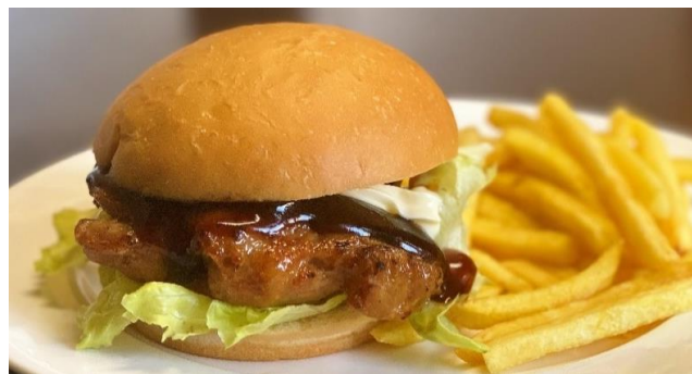
照り焼きチキンバーガー ..... 800円 フライドポテト付