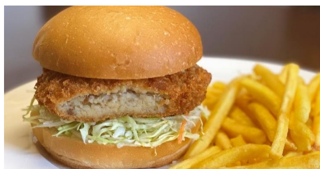
コロッケバーガー ..... 650円 フライドポテト付