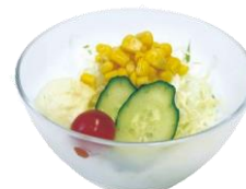
ミニサラダ 250円 *ドレッシングをお選びください