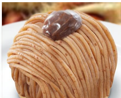
渋皮栗のモンブラン 450円 +ドリンク代