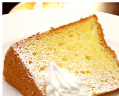
シフォンケーキ 350円 +ドリンク代