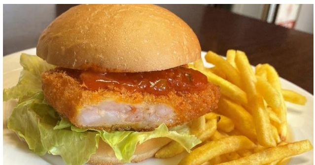
海老カツチリバーガー ..... 800円 フライドポテト付