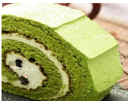
抹茶のロールケーキ 430円 +ドリンク代