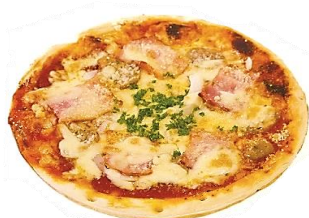
オリジナルピザ 750円