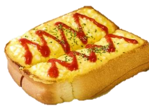
たまごトースト 400円