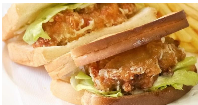
チキン竜田サンド ..... 880円