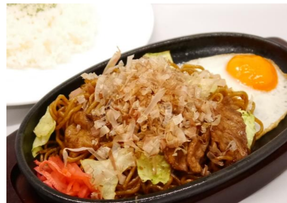
焼きそば 950円 ライス・サラダ・ドリンク付き