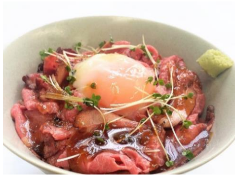
ローストビーフ丼 1,250円 サラダ・ドリンク付き