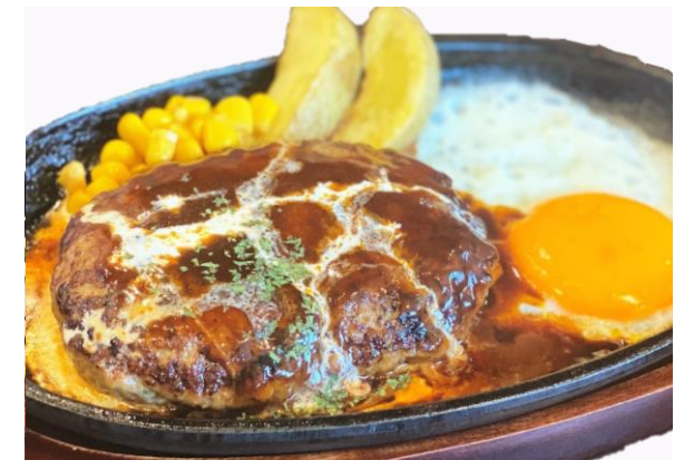
鉄板ハンバーグ 1,150円 デミグラスソース ライスorパン・サラダ・ドリンク付き