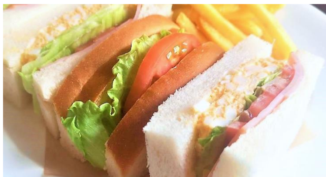
ミックスサンド ..... 700円