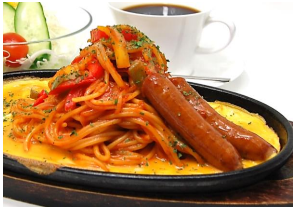
鉄板ナポリタン 950円 サラダ・ドリンク付き