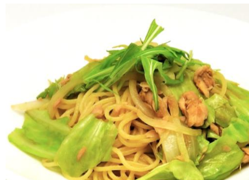
キャベツとツナの和風ソース 1,000円 サラダ・ドリンク付き