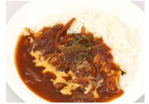
ハヤシライス 1,080円 サラダ・ドリンク付き