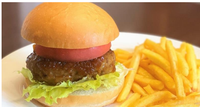
肉厚ハンバーガー ..... 800円 フライドポテト付