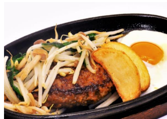
鉄板ハンバーグ 1,150円 ライスorパン・サラダ・ドリンク付き