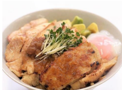
チキンステーキ丼 1,150円 *スパイシーなガーリックライスを使用しています* サラダ・ドリンク付き