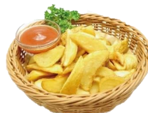
皮付きポテトフライ 400円