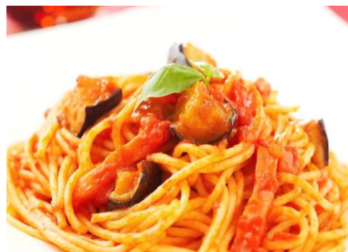
ナスとベーコンのアラビアータ 1,000円 サラダ・ドリンク付き