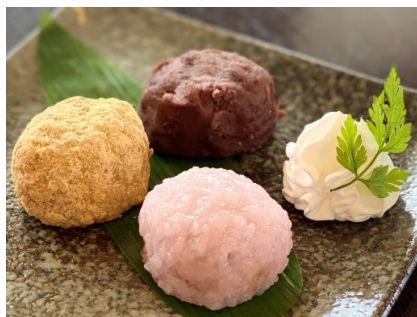
さくら三色餅 430円 +ドリンク代

*下記価格はセット価格となっております、単品でご注文の際は表示価格にプラス100円となります。*