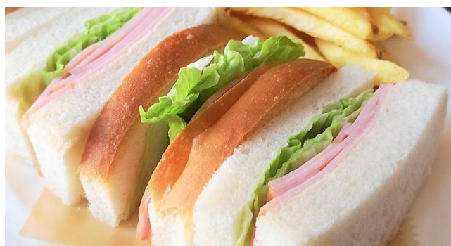
ハムサンド ..... 650円