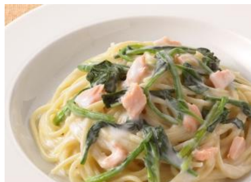
ほうれん草とサーモンのクリームソース 1,000円 サラダ・ドリンク付き