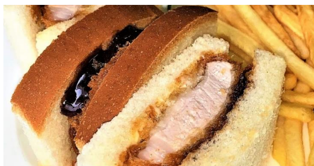
カツサンド ..... 900円