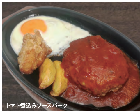
トマト煮込みソースバーグ