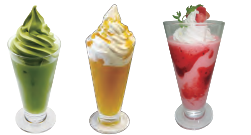
抹茶フロート マンゴーフロート ストロベリースムージー