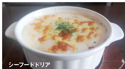
シーフードドリア