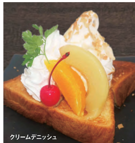
クリームデニッシュ