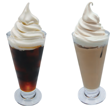
コーヒーフロート