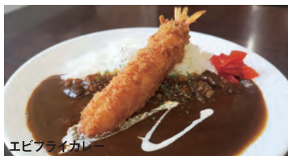
エビフライカレー