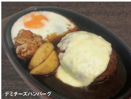
デミチーズハンバーグ