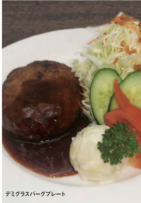
デミグラスバーグプレート