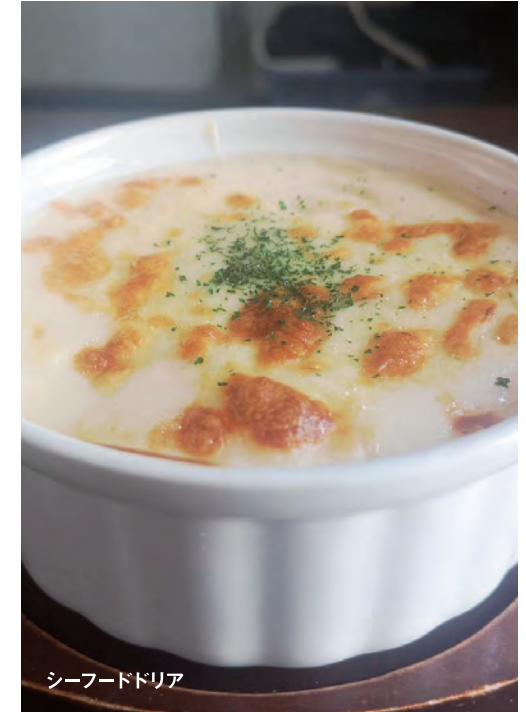
シーフードドリア