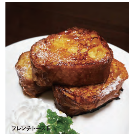
フレンチトースト